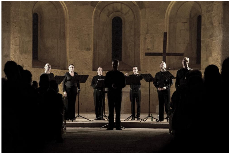
Jeudi 14 août 2014, Festival Musique et Esprit du Thoronet (Var) Répons de Ténèbres, C. Gesualdo